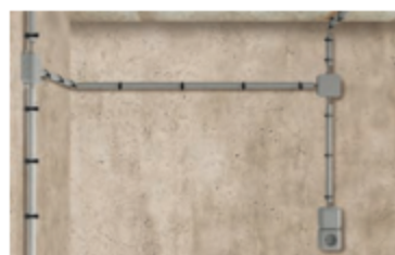
Гибкие и жесткие трубопроводы