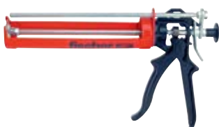
Выпрессовочный пистолет FIS AM