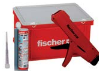
FIS V 360 S HWK большой контейнер с выпрессовочным пистолетом