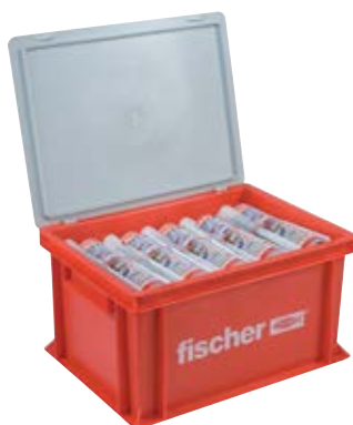
FIS V 360 S HWK большой контейнер