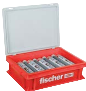
FIS V 360 S HWK малый контейнер