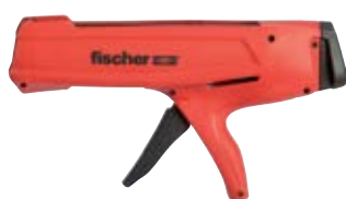
Выпрессовочный пистолет FIS DM S