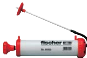
Продувочный насос ABG