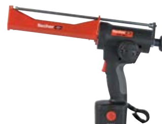
Аккумуляторный выпрессовочный пистолет FIS DC 4000 S