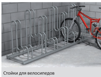
Стойки для велосипедов