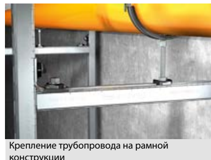
Крепление трубопровода на рамной конструкции