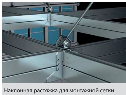
Наклонная растяжка для монтажной сетки