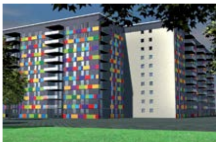
Восстановление поверхностей, подверженных воздействию атмосферных факторов