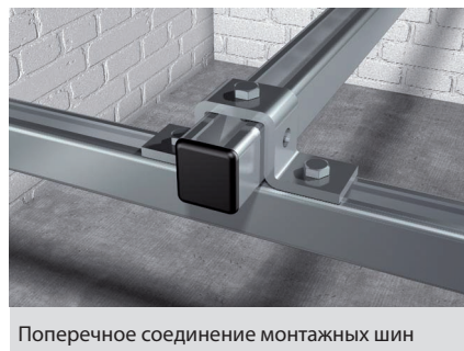
Поперечное соединение монтажных шин