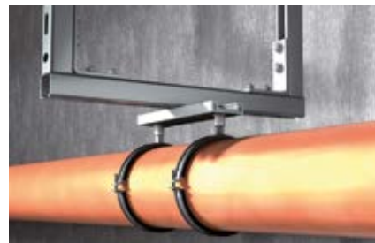
Удлинение трубопровода с помощью скользящей опоры и трубы