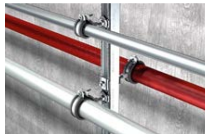
Горизонтальное крепление трубопровода