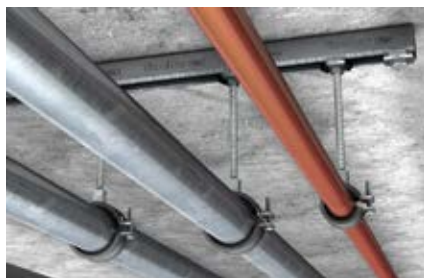
Крепление трубопровода с помощью монтажной шины