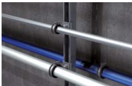
Монтаж поперечных труб к шинам