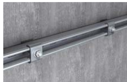
Монтаж шин к стене