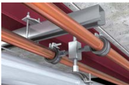
Крепление с монтажным кубиком