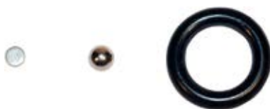
Комплект принадлежностей для SZE