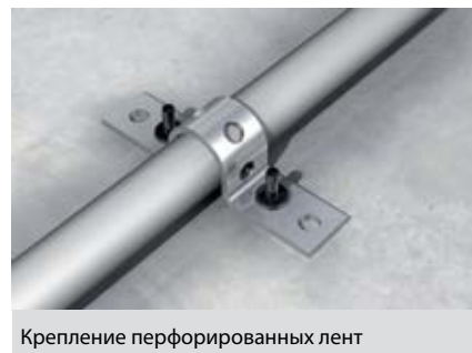
Крепление перфорированных лент