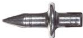
Гвоздь для крепления прижимов ED