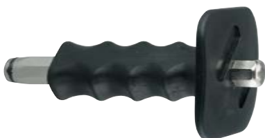
Установочный инструмент для забивания гвоздей по бетону SZE