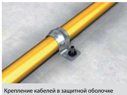
Крепление кабелей в защитной оболочке