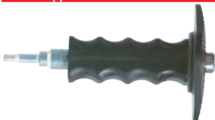
Установочный инструмент FZED plus